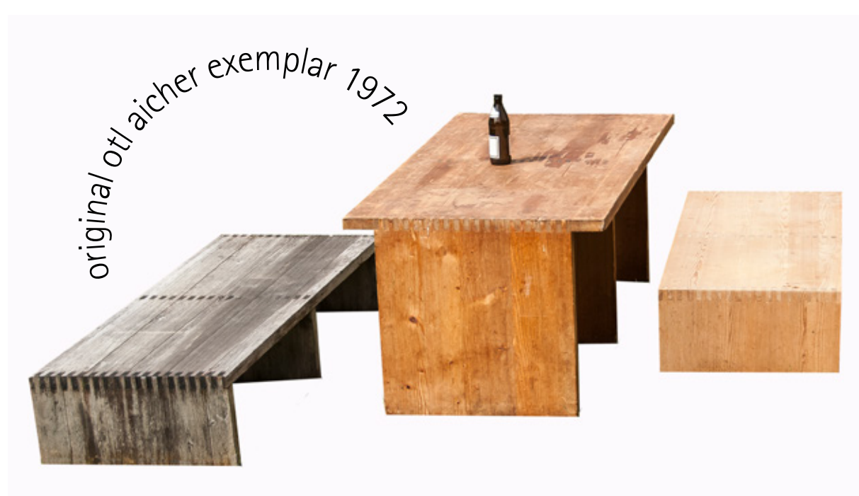
Foto: Tilo Grätz, Tischsegment von Otl Aicher aus Privatarchiv | Gestaltung: Claudia Kircher www.kircherdesign.com